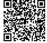
LINE 公式アカウント （職員採用情報）