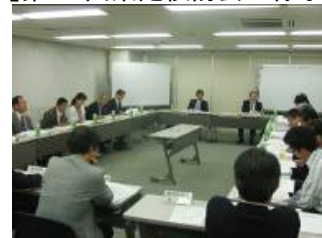
【第12回策定検討会の様子】

平成21年10月5日に浜松市役所において、「第12回浜松市都市計画マスタープラン策定検討会」を開催しました。