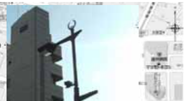
⑥家康の散歩道沿いの街路灯