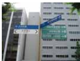
③市役所前交差点付近