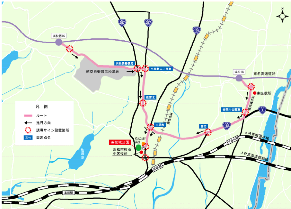
東名 I C からの誘導サイン設置位置の提案

遠隔地から車で来る人のために東名 I C（浜松 I C 及び浜松西 I C）からの誘導サインの位置を提案する。なお、駅からのアクセスは、既存サインでたどりつくことができる。