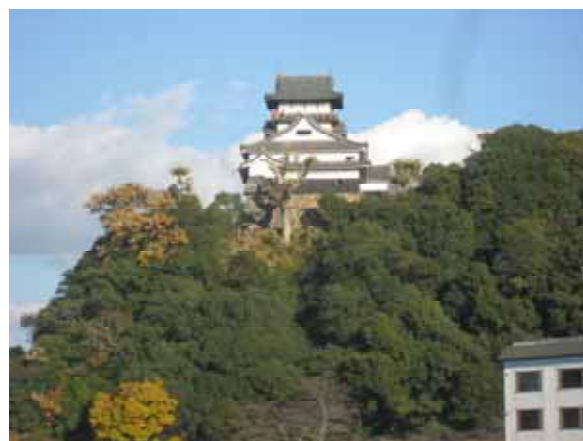
樹木伐採、剪定の事例（犬山城天守閣周辺）