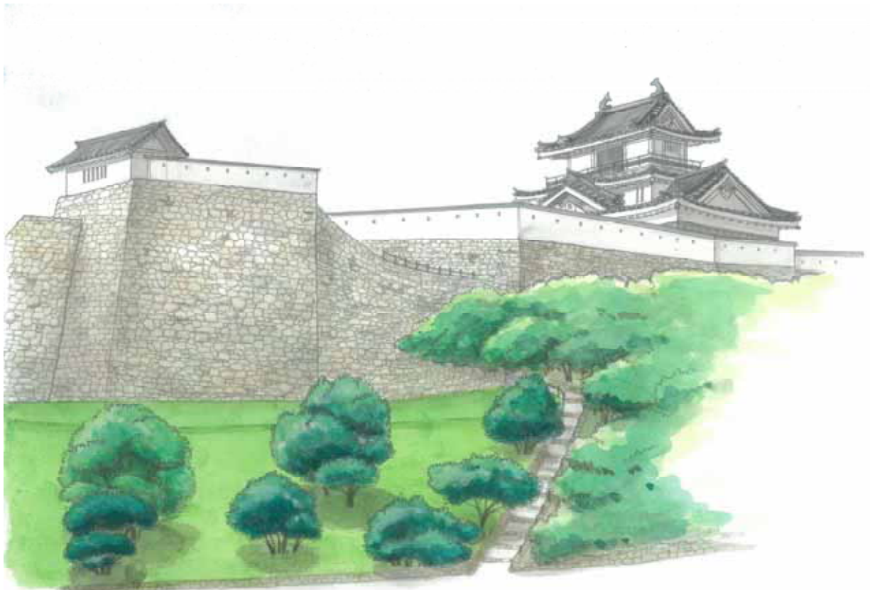
樹木伐採後のイメージ