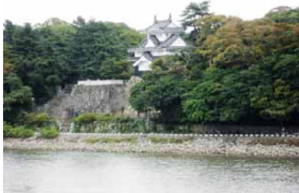
樹木伐採の事例（吉田城鉄櫓周辺）

浜松城公園全体の歩行者向け入口として潤いのある快適な空間を創出するため、適度な緑陰を提供する修景植栽を行う。また、歴史的な雰囲気をもつために、公園外の周辺環境を遮蔽するように緑を配置する。