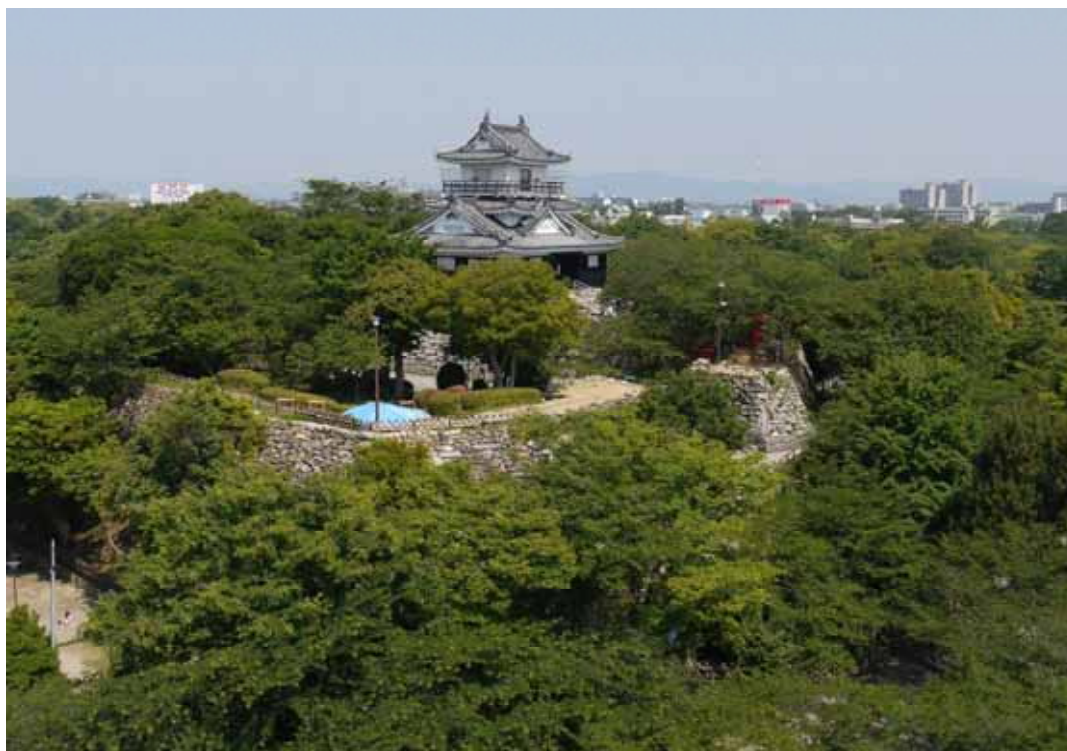
現在の天守曲輪周辺の様子（本庁屋上から平成 22 年 6 月撮影） 樹木が繁茂し、石垣が見えない。