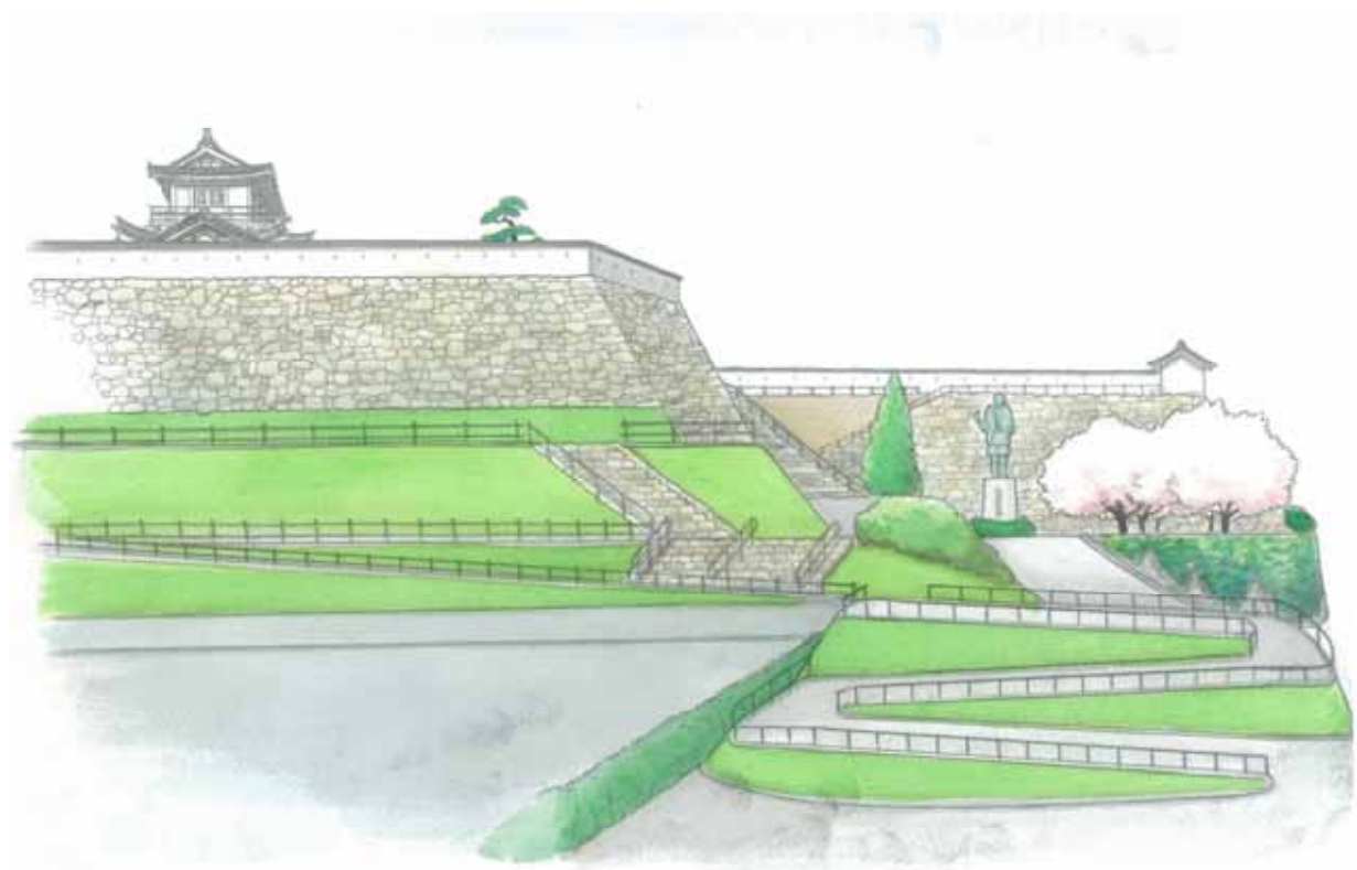
樹木伐採後のイメージ