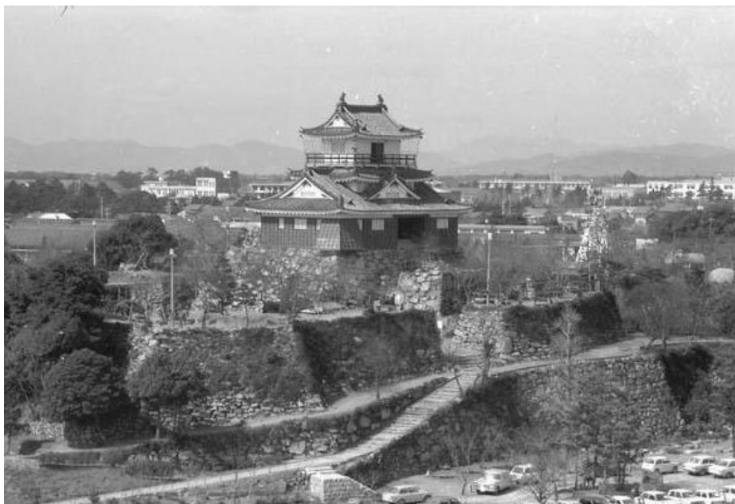
既存植生整備による天守曲輪周辺の目指す姿（昭和 40 年代 秋～冬期撮影） 石垣の様子が良くわかる。