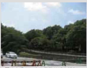
公園駐車場から富士見櫓付近を望む