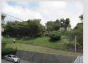
南エントランスから天守曲輪石垣を望む