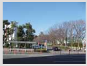
東側から天守曲輪石垣を望む