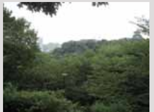
展望広場から天守・富士見櫓付近を望む