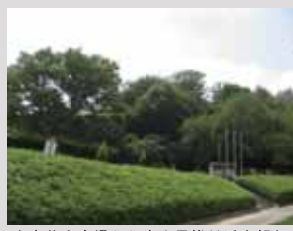
中央芝生広場から富士見櫓付近を望む