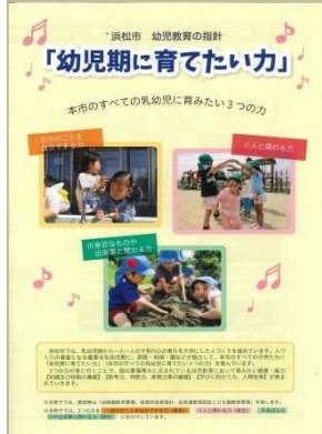
浜松市 幼児教育の指針