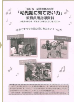
教職員用指導資料