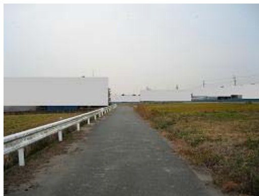
5.米津地区 (H5完了) 雑草が道路にまで侵入し、農耕が放棄されている