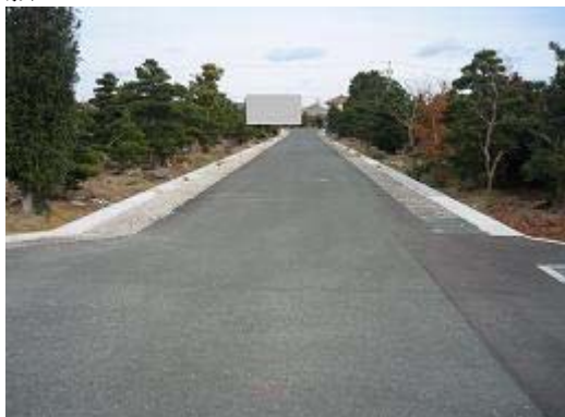
1.浜北新原下善地区 農道拡幅と側溝設置 総事業費28百万円の内、平成18年度28百万円、農地畑5.3ha、家屋10戸、延長776m