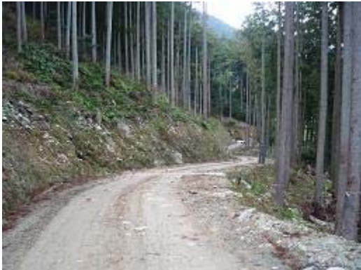
7. 施業道向山線(龍山)