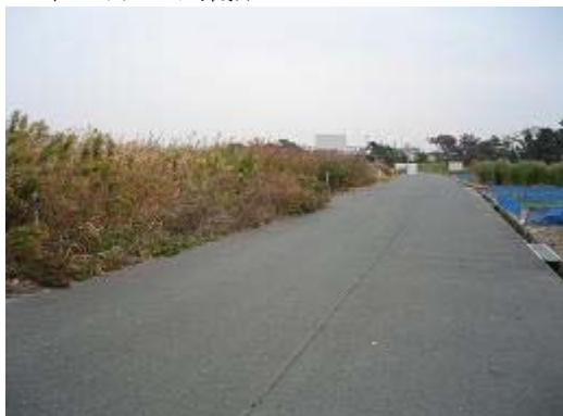
1.白羽地区 (H6完了) 雑草が生い茂り、放置された農地。畑かんも無用