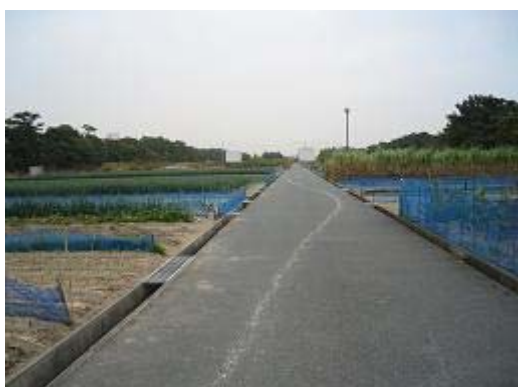
3.法枝地区 (H5完了) 防風林の北側に広がり、高い雑草地も見える