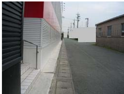
6.店舗・建物が道路際いっぱいまで建てられている。