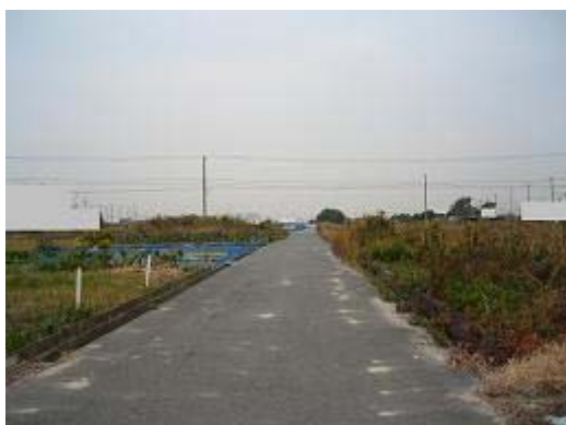
9.小沢渡地区 (H8 完了) 放置された農地から伸びた雑草が道路にまで侵入