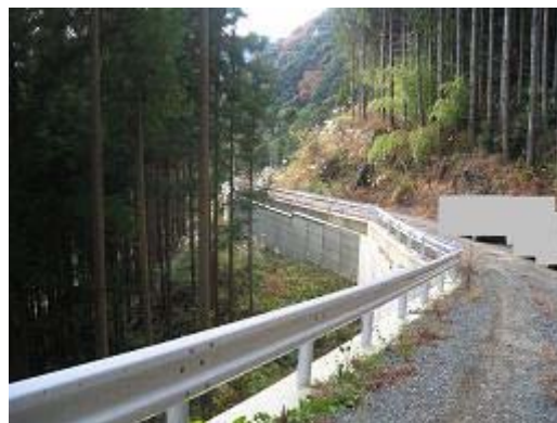
5.天竜龍山戸倉地区 総事業費167百万円の内、平成18年度は8百万円、農地1.1ha、家屋2戸、延長133m