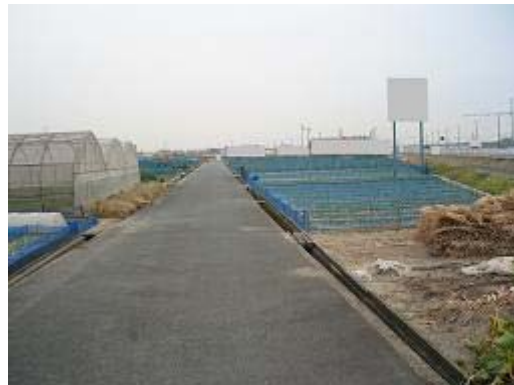
10.小沢渡地区 (H8 完了) 畑の中に大きな看板が立つ