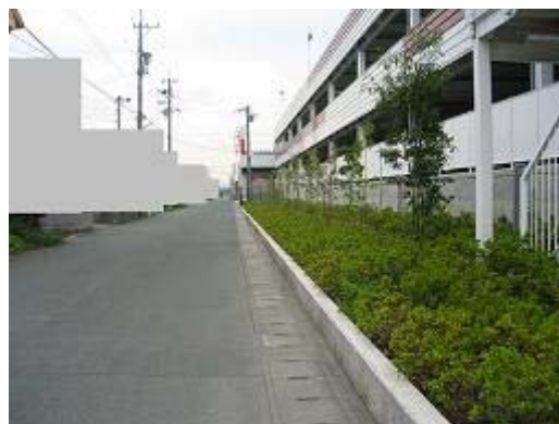
5 店舗駐車場 緑地帯が設けられている。