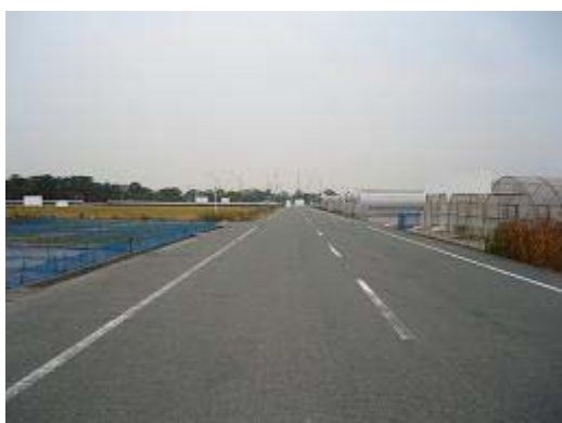
8.小沢渡地区 (H8 完了) 道路が広く、国1の抜け道になる