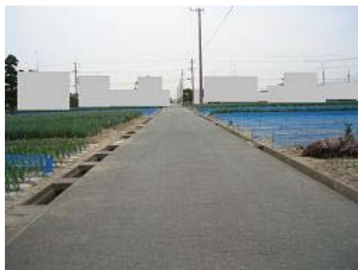
6.米津地区 (H5完了) 住宅との混在地