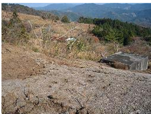
3.林道観音山線 県の放牧場が撤退・廃止になった後は 放置されている