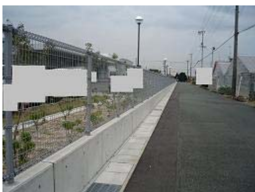
2.工場敷地緑地帯の西外側を堅固なフェンスで囲む。