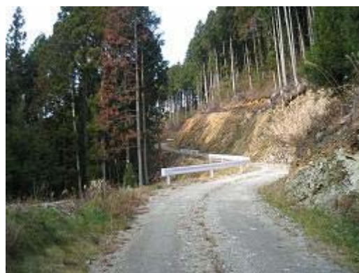
6.施業道向山線(龍山) 総事業費 85 百万円 事業量 1,700m m単価 50 千円/m 期間 H18—H21