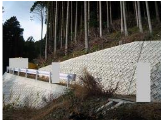
4.天竜龍山戸倉地区 総事業費167百万円の内、平成18年度は8百万円、農地1.1ha、家屋2戸、延長133m 擁壁にお金がかかる。