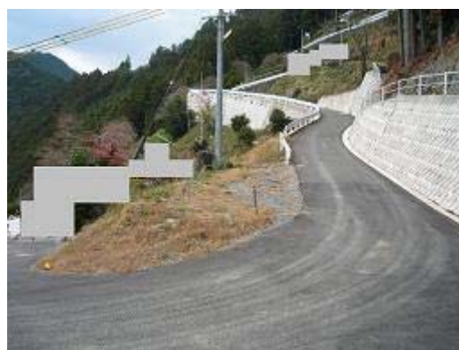
6.天竜龍山岩明地区 総事業費145百万円の内、平成18年度30百万円、農地1.1ha、家屋3戸、延長111m よう壁、転落防止工事も実施。