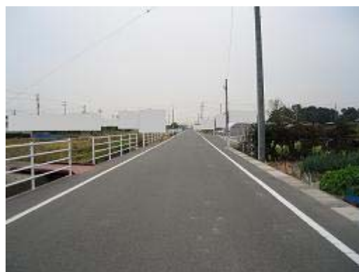
11.小沢渡地区 (H8 完了) 事業地区内から地区外の浜松方面を見る