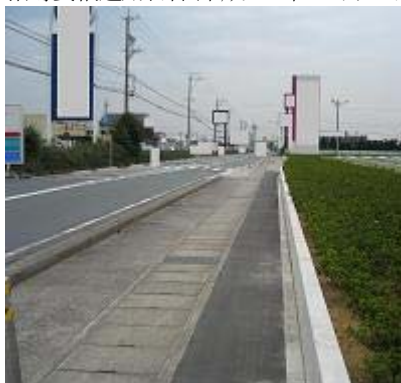
7.イオン市野店南側 フェンスを設けず、すっきりしている。