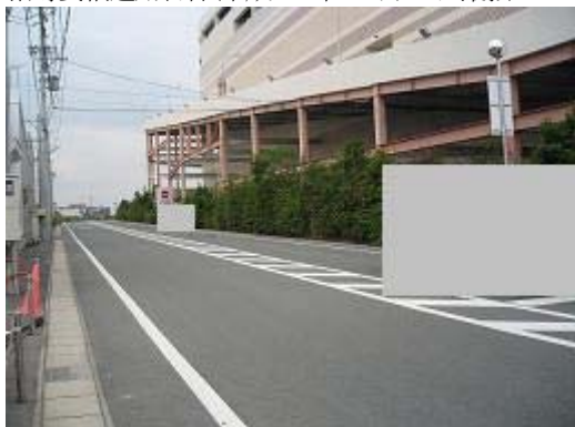
1.志都呂イオン東側 歩道がなく、緑地帯になっている。