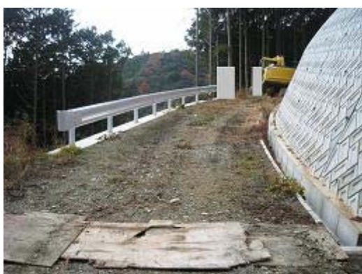
3.天竜龍山戸倉地区 総事業費167百万円の内、平成18年度は8百万円、農地1.1ha、家屋2戸、延長133m 森林を切り開いて、農道を作る。