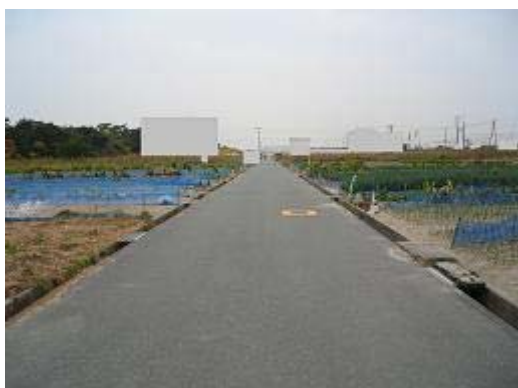
2.法枝地区 (H5完了) 工業と放棄地が混在している