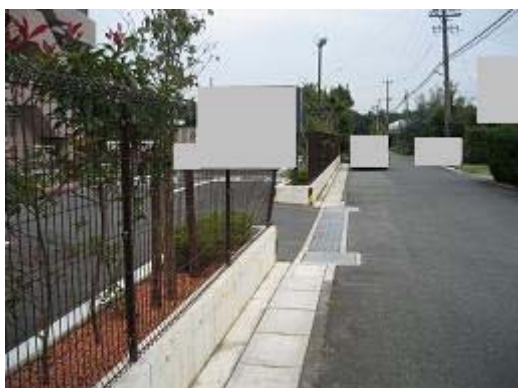
3 工場敷地緑地帯の北外側を堅固なフェンスで囲む。