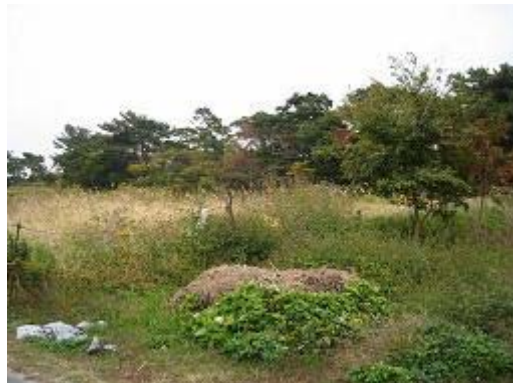
4.法枝地区 (H5完了) 防風林が荒れて、農耕が不可能になって放置