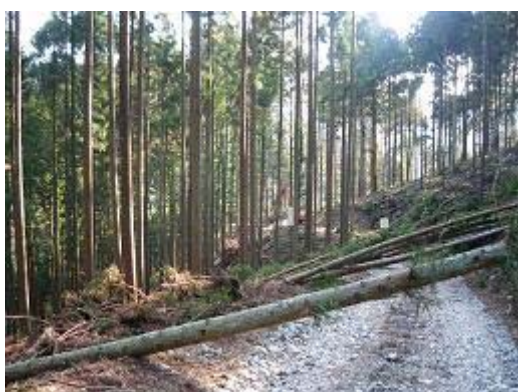
2.林道黒松線(天竜区熊) 間伐実施中の森林