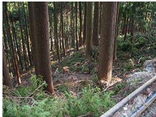
4.林道黒松線(天竜区熊) 枝払いはされているが、間伐前 太陽光線はよく通る