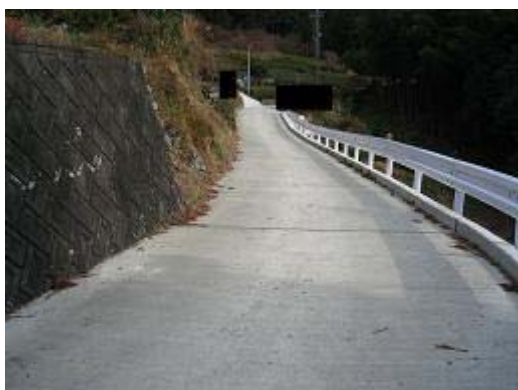
2.天竜高平地区 奥深い山中の茶畑に道路 総事業費20百万円の内、平成18年度20百万円、農地1.2ha、家屋3戸、延長139.8m 生活道路の拡幅