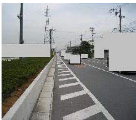
8.イオン市野店東側 歩道がなく、車の往来が激しい。