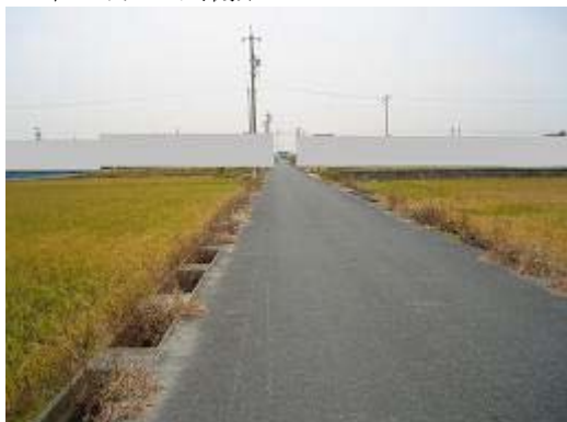
7.米津地区 (H5 完了) 雑草が側溝をおおっている