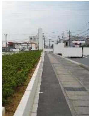
9.イオン市野店南側 フェンスを設けず、すっきりしている。