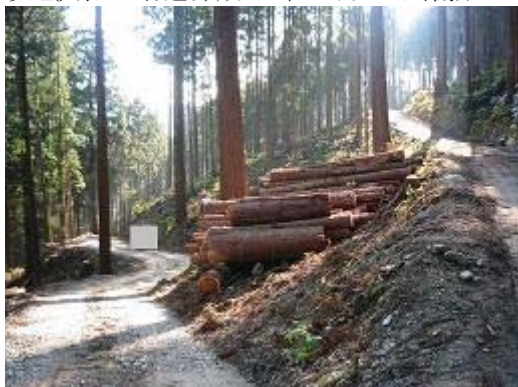
1.林道黒松線(天竜区熊) 総事業費 80 百万円 事業量 1,749m m単価 46 千円/m 期間 H16—H18