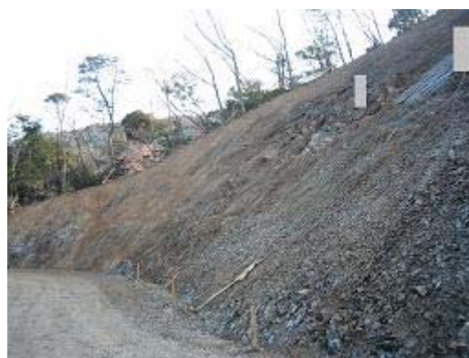
5.林道観音山線 林道が崩れたため擁壁工事中の現場