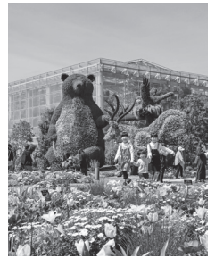
Boletim informativo de HAMAMATSU Maio /2024