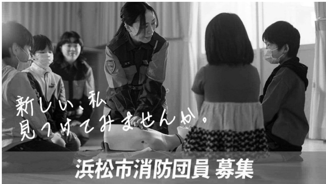
浜松市消防団加入促進ポスターより