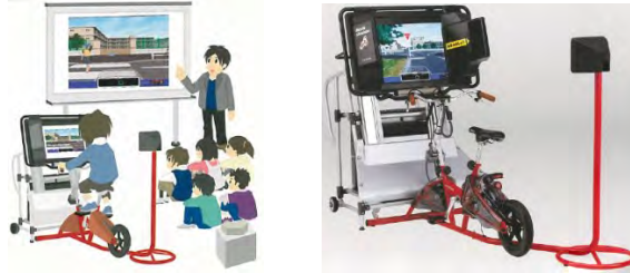
図 38 自転車シミュレーター