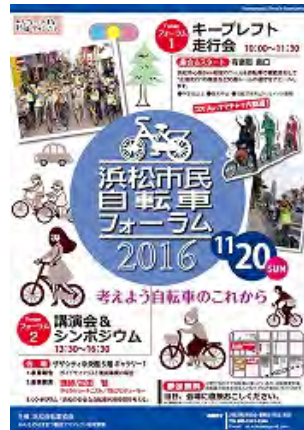
図 35 浜松自転車協会による自転車左側通行周知のための模範走行会ちらし (平成 28 年(2016 年))