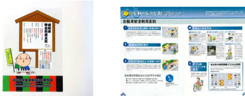
図 39 自転車安全利用五則を印刷したクリアファイル