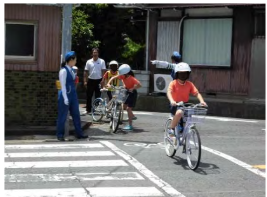
図 37 交通安全教育の様子