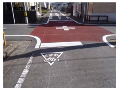
図 34 生活道路における自転車安全対策例(船越・野口地区)