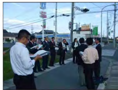
図 33 通学路点検の様子