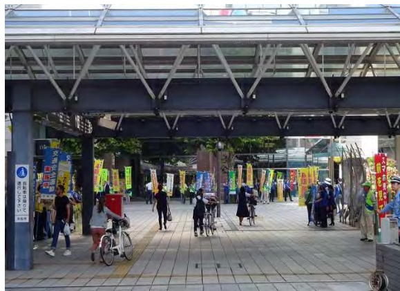
図 36 街頭における啓発・指導の様子