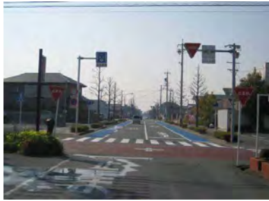
図 31 自転車専用通行帯(南区本郷町)