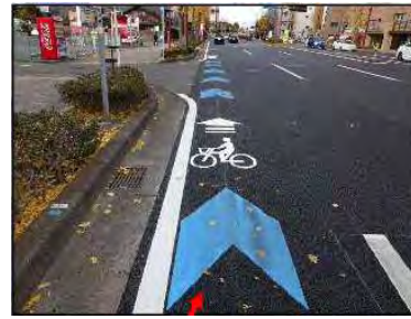
図 32 車道混在(中区伝馬町～市役所前)