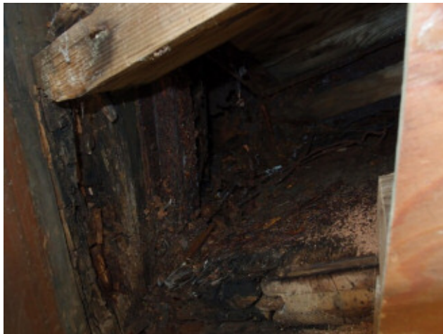
施設内部梁の腐食