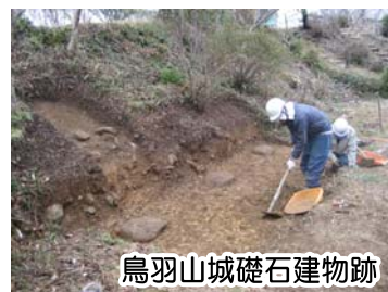
鳥羽山城礎石建物跡