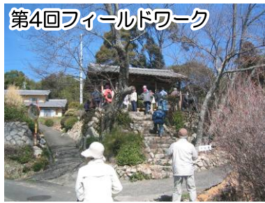
第4回フィールドワーク

最終回となる第4回は、気賀宿(犬くぐり道・西柝形・獄門竈など)、気賀近藤家墓所、修理殿松、山田一里塚、小引佐、岩根薬師堂などを見学するフィールドワークでした。このフィールドワークでは、姫街道の松並木を考える会、細江町歴史・文学グループの皆さんにご協力いただき、天候の心配された日程でしたが晴天に恵まれ、歴史ある街道の魅力を体験していただくことができました。