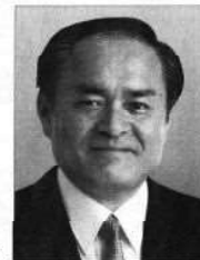
社民党党首 吉田 忠智