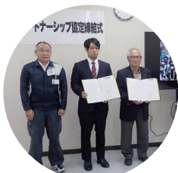
浜松市生きものパートナーシップ協定締結式