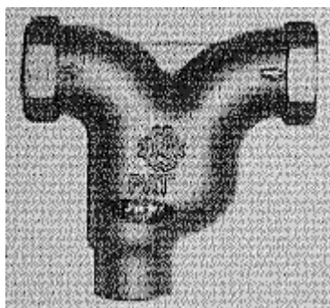
図1 スプリンクラー専用継手