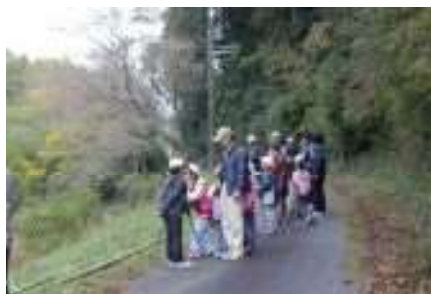
小学校での 観察授業