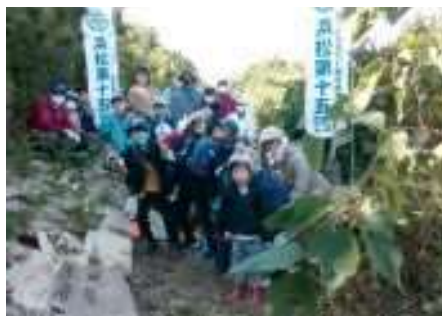
防潮堤植樹並びに育樹作業