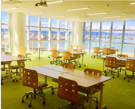
舞阪サテライトオフィス