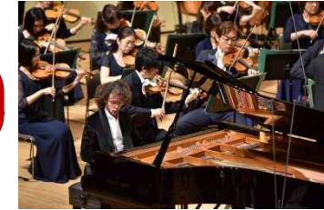
ピアノコンクール