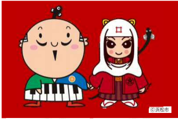
出世大名 家康くん 出世法師 直虎ちゃん