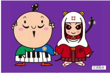
出世大名 家康くん 出世法師 直虎ちゃん