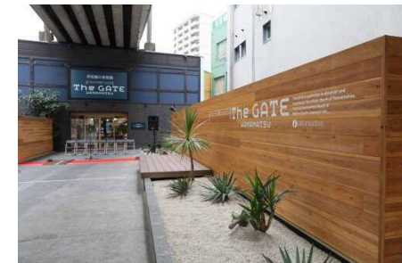
The GATE Hamamatsu