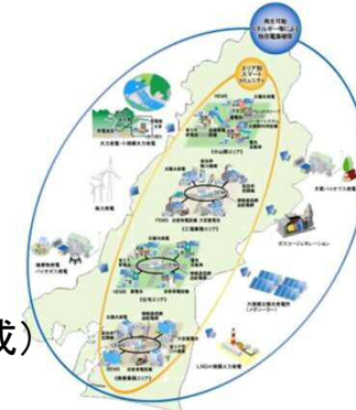
スマートシティプロジェクト