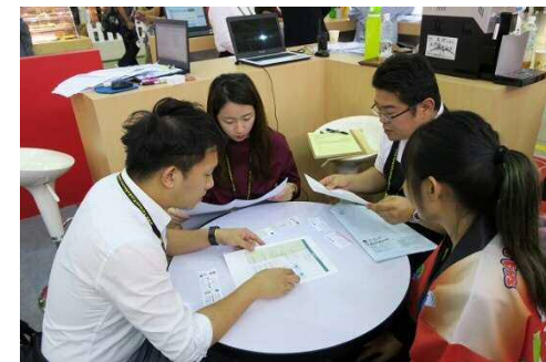
フードタイペイ 商談の様子