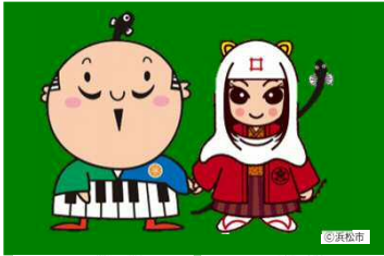
出世大名 家康くん 出世法師 直虎ちゃん