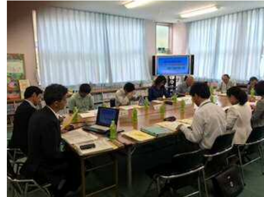
推進モデル校運営協議会