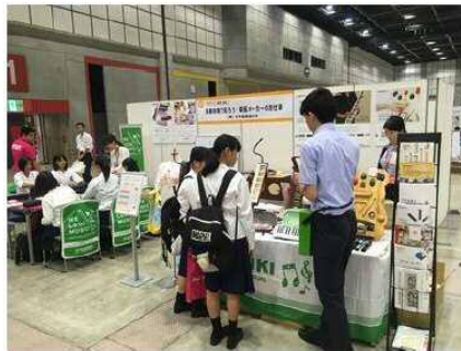
未来ビュー in 浜松