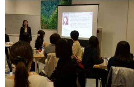
浜松女子Happy Work Labo