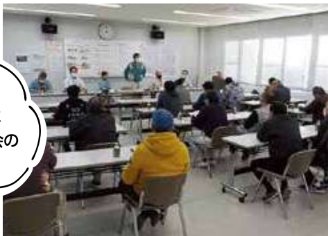
農地の貸し借りに関する説明会の様子