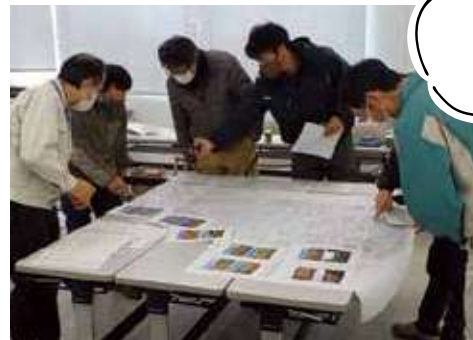
農業者、農協、市による話し合いの様子