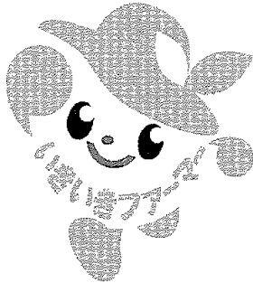
いまいきファーマーロゴマーク