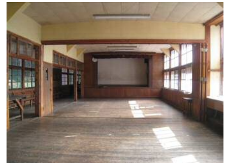
校舎2階 理科室 音楽室