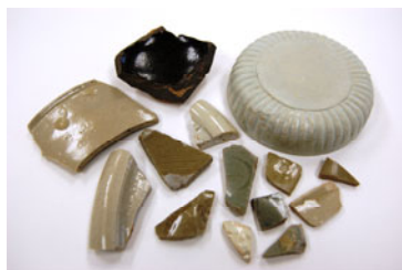
出土した中国産陶磁器