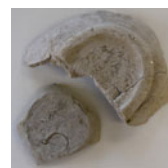
墨書された山茶碗