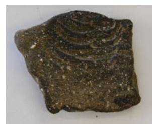
出土した弥生土器

弥生土器は1点だけ出土しましたが、遺構が確認できないことから、弥生時代の集落は調査区内には広がっていないと考えられます。しかし、上組遺跡から東側に少し離れた所に位置する飯田遺跡群では、弥生時代の集落跡が見つかっており、上組遺跡の周辺にも弥生時代の集落が広がっていた可能性が考えられます。同じく古墳時代の遺物も非常に少なく、集落は今回の調査区から離れた位置に広がることが想定されます。