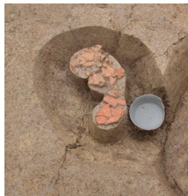
土坑から出土した奈良時代の遺物

鎌倉時代の遺構は、小穴や土坑、溝跡、井戸跡などが見つかりました。そのなかで注目されるのは、調査区内で多く見ついている溝跡です。検出した多くの溝跡は東西や南北に軸が向いており、土地を区画するような使われ方をしていたと考えられます。特に調査区の西端と東端で検