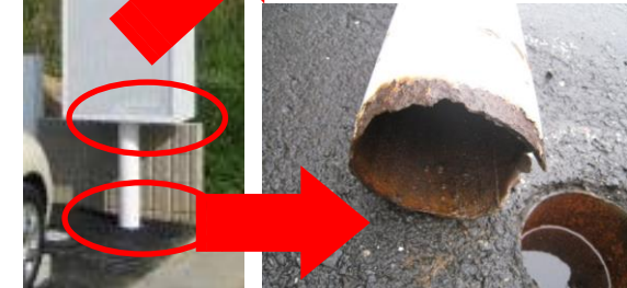
↑柱根元のサビを放置し、倒壊。

倒壊・落下の危険を見つけたら! ◆付近を立入禁止にし、見張りを置く。 ◆信頼できる屋外広告業者に連絡。 ◆人通りの多い場所では警察にも連絡。