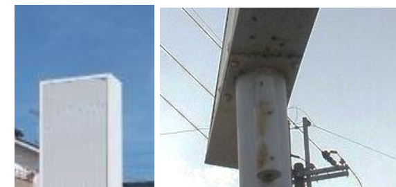
↑看板本体からポールへの汚ダレがあると、接合部にサビや腐食が進行する恐れ。