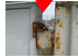
←取付金具のサビや腐食。ボルトやビス等が欠落していたら緊急の対応が必要。放置すると看板が落下する恐れも。