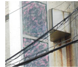
←ブラケット下に汚ダレが見られると、内部の取付金具にサビや腐食の可能性もある。