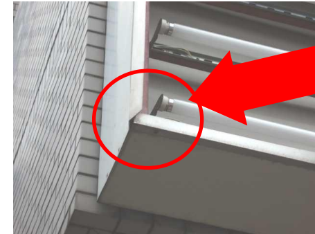
←パネルの変形、ズレ、破損の他、パネルの押さえ枠が変形し落下する場合も。

表示パネルの四方を押さえ枠で固定する欄間看板。複数枚のパネルを使用する場合は、隣り合うパネル同士をきちんと固定しないと、振動や風などで落下する恐れがあります。