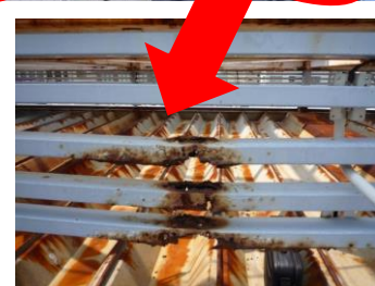
↑目隠しルーバーのサビ・腐食。