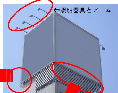
←照明器具とアーム

外照式の屋上看板では照明器具のアーム接合部の腐食やボルトのゆるみがあると器具が落下する恐れがあります。