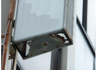
↑看板底部の留め具が壊れるとアクリル板が抜け落ちる原因にも。