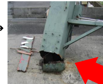
折れた柱の根元。点検口のボルト穴からサビが入り腐食して、鉄骨が破断した。

交通の激しい沿道で看板の柱が折れたが、隣地の看板が支えとなり、道路への倒壊を免れた事故。電線を切断すると停電による損害賠償額は膨大な金額になることも。