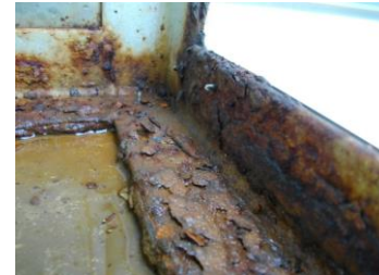
↑看板面(アクリル板)のひび、割れ、ゆがみ板面の落下により、内部に水が入り腐食する原因に。