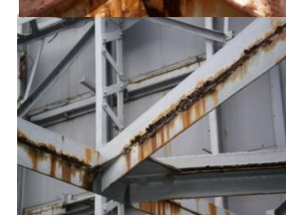
↑内部鉄骨のサビ・腐食。