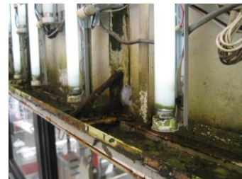
↑内照式看板内部の腐食、部材の腐食器具の劣化による出火の恐れも。