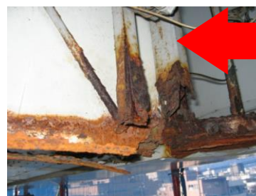
↑板面裏側のサビ、腐食。サビによる腐食はミルフィーユ状に剥がれ崩落する恐れも。