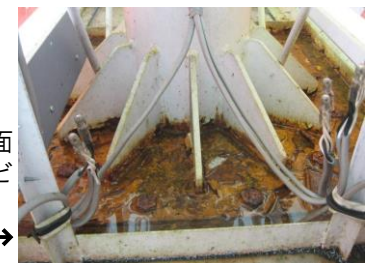
看板の根元がカバーで覆われている場合、表面はきれいでも内部でサビが進行している恐れも。