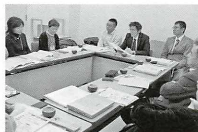
自殺対策地域連携プロジェクト研修の様子

市では、子どもから大人まで、そして浜松に住むすべての人々に、こうした事業を通して、「いのちの大切さ」についてメッセージを送り続けていきたいと考えます。