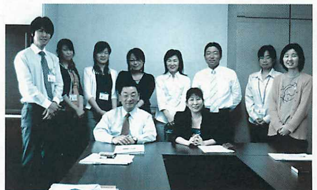
精神保健福祉センターのスタッフ

※自立支援医療（精神通院医療）の支給認定に関する事務のうち、専門的な知識及び技術を必要とするものの認定をおこなうこと。