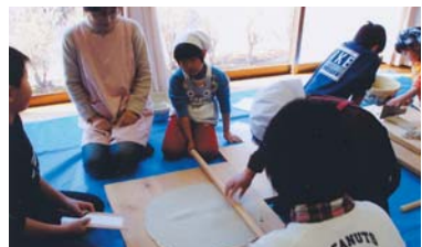
そば打ちのほか、こんにやくや五平餅作りも体験できる