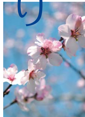
3月下旬から4月上旬に咲く700本のアーモンドの花は必見