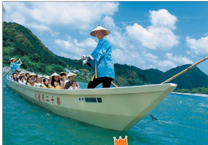
天竜川の四季をのんびり楽しむ伝統の舟下り