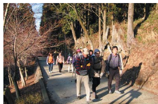
秋葉山表参道は風情があって、初心者ハイカーにもびったりの距離

◆森林インストラクターの問い合わせ 静岡県西部農林事務所天竜農林局森林整備課 TEL.053-926-2314