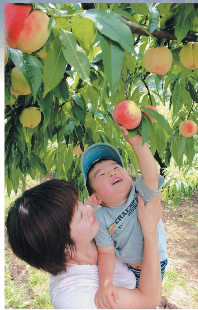
モモの旬は6月から7月。親子で楽しい収穫体験を!