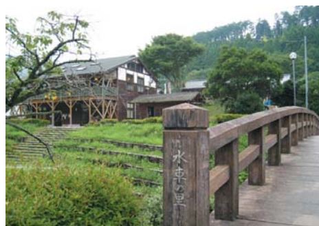
そば処「くんまかあさんの店」、物産館「ぶらっと」、手づくり工房「くんま水車の里」がそろう

◆天竜浜名湖鉄道 浜松市天竜区二俣町阿蔵114-2 TEL.053-926-2111 運転期間/3月20日~11月30日 運行時間(無料送迎バスが天竜二俣駅を出発する時間)/平日11:00、13:30、土日祝11:00、13:30、15:30 (GW、夏休み期間中は増発) 料金/大人2,300円、子供1,150円、幼児600円、貸し切り船42,000円(21人以上の場合は1人増すごとに2,100円加算) http://www.tenhama.co.jp