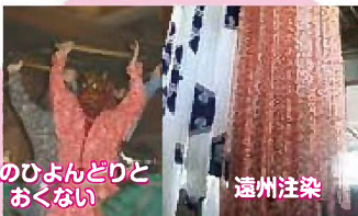
遠江のひよどりとおくない