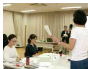
グループワークの発表の様子