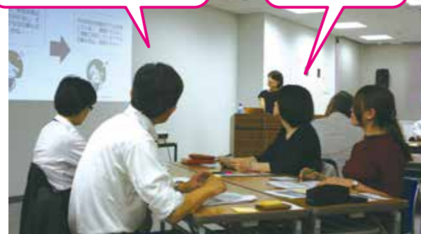
講師の話真剣に聞く参加者たち