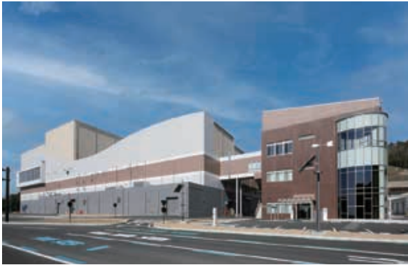
4月に運営を開始した天竜清掃工場