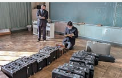
小学校で使われず眠っている管楽器の状態を調査点検する楽器専門店のスタッフ

答弁 昨年度の不登校児童・生徒のうち、長期間何らかの支援と結びついていない子どもが25人ほどいると認識しており、本事業はその子どもたちに対する支援の第一歩として実施するものである。今後、事業の充実を図る中で、検討していきたい。