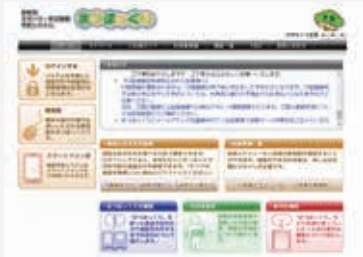
浜松市スポーツ・文化施設予約システム「まつぽっくり」

答弁 コード決済に対応できるサービスが対応するところであり、始めたところであり、対応するサービスの数も少ないため、今回の予算要求では、現時点で幅広く提供されているクレジットカードに対応したオンライン決済サービスを想定している。なお、サービスの選定に当たっては、コード決済などに将来対応できる拡張性も十分に考慮して検討していく。