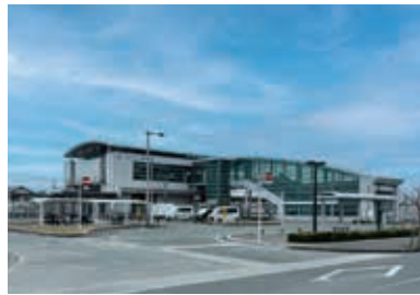
都市計画マスタープランで生活拠点に位置づけられている舞阪駅

答弁 JR舞阪駅周辺地区は、駅周辺の交通便利性に優れた立地条件を活かしたまちづくりを進めていくために、都市計画マスタープランの土地利用の分野別方針において、日常生活に欠かすことのできない身近なサービスを提供できる都市機能の集積を図る生活拠点に位置づけている。 当地区はこれまで南