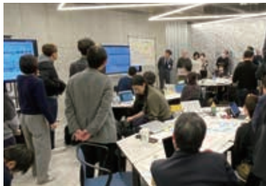
自治体職員向けウェルビーイング指標活用セ ミナー