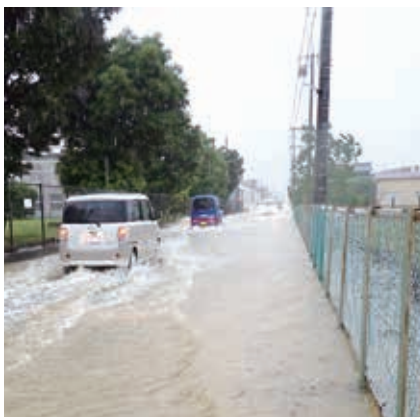
6月2日の大雨で冠水した道路(中央区神原町)

このほか、道路の被害状況や復旧のめど、被災者への支援についてなど、多くの質疑・意見がありました。