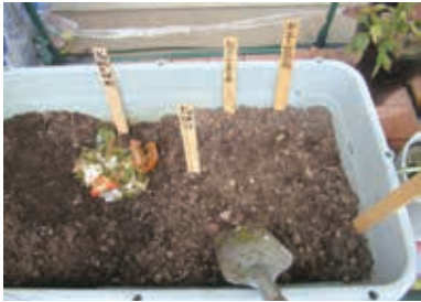
生ごみ削減型処理装置「キエーロ」の実例

答弁 雑がみについては、集積所回収を望む声もあるが、収集品目を増やすことでの大幅な経費増加やスペース確保の課題があるため、自治会などの地域コミュニティによる集団回収に加えて民間事業者や市による拠点回収を実施している。 また、生ごみの減量