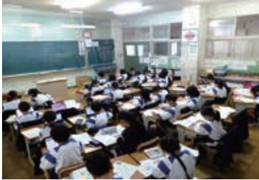
少人数学級編制 (はままつ式30人学級編制) 未実施の教室