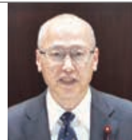
丸 英之 公明党