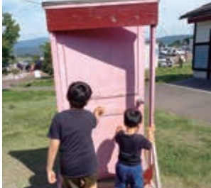
子育て支援の次なる扉を開きます