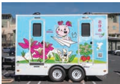
千葉県君津市が配備したトイレトレーラ ー 出典：君津市ホームページ