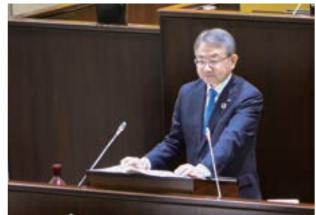
6年度施政方針を表明する中野市長

同日の本会議では、6年度関係議案の上程に当たって市長から施政方針の表明がありました。その中で、「浜松から地方創生」を基本方針と掲げ、6年度は「まち・ひと・しごと」の創生を一体的・総合的に進めることにより、浜松を元気にする取組を加速化するとし、就任時の初心を忘れることなく現場に足を運び、多くの市民や企業などと議論を重ね、声を聞きながら、オール浜松で「元気なまち・浜松」を実現していくとの決意が述べられました。