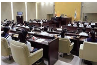
本市が実施している若者が市政へ提案を行う取組(中学生未来議会)