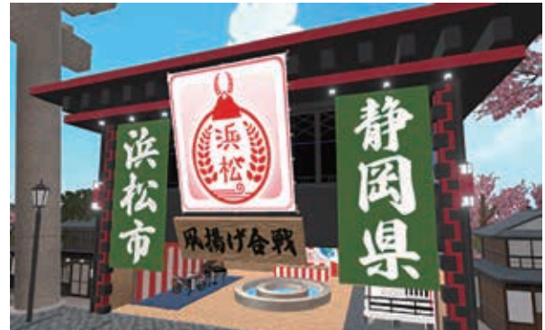
メタバースイベントでの浜松市ブース