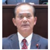
酒井 豊実 日本共産党浜松市議員