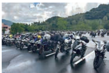
1100台以上の二輪車が参加したバイクイベント(KATANAミーティング2023)