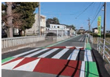
運転者に歩行者優先を促すスムーズ横断歩道