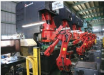
産業用ロボット導入例

答弁 ロボット導入費用の平均約1000万円の2分の1の補助率としている。件数については他都市の実績などを踏まえて設定しており、まずはこの件数で開始していく。