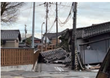
能登半島地震で被災した家屋