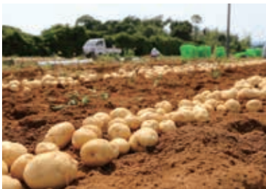
ブランド化された三方原ばれいしょ