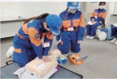
AEDの使い方や胸骨圧迫など一次救命処置に必要な技術を学ぶ学生消防団員

答弁 訓練や様々な体験をもらい、そこで得たものを市公式のSNSだけでなく、学生消防団員個人でも発信してもらうことで、学生の入団促進や、消防団活動の認知度向上につなげていく。