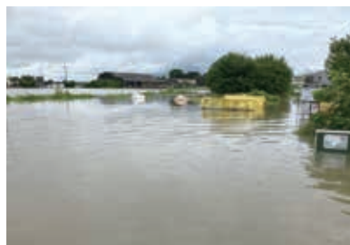
豪雨により氾濫した河川(浜名区)

的な要因により度々浸水被害が発生していることから、6年度は、中郡・大瀬小学校の校庭貯留施設の整備を進めるとともに、沿川における新たな雨水貯留施設の検討も含め、効果的な浸水被害軽減対策を推進していく。