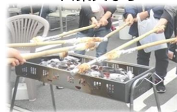
棒パン焼き などなど……