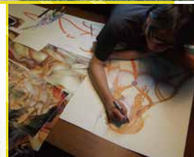
A 表面:《竜王》2001年 53×77.5cm 水彩、紙 A: ポッティチェリ「Venus and Mars」の模写 2019年 179×70cm ボールペン、紙 B:《BATHING BEAUTY IN THE WOOD》2001年 121×91cm 紙、木 C:《KKO-023-SHRINE》1995年 110×110cm CG、紙 D:《Sticker mosaic Maria》2003年 89×89cm シール、アクリル板 E:《高原の少女》2015年 40×31cm 水彩、紙