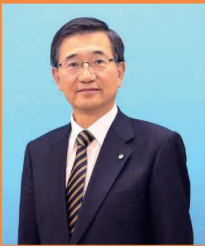
浜松市教育長 花井和徳