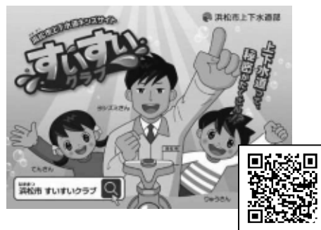
＜配布したPRシールのデザイン＞