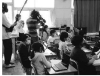
<新サイトを活用した授業の様子（テレビ取材あり）>