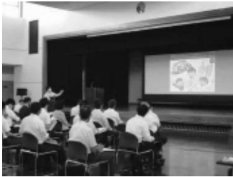
<教員向けにプレゼン実施>