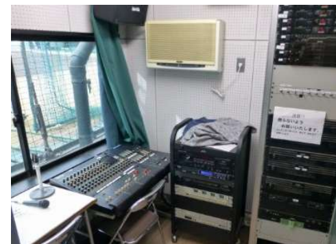
【浜松球場放送設備】 放送設備の老朽化