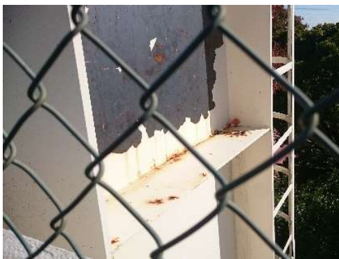
【浜松球場照明塔全体】 塗装の剥がれ落ち