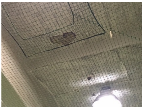
【ブルペン天井】 破損