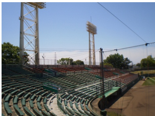
【雨天時対策】 屋根付きスタンド無し