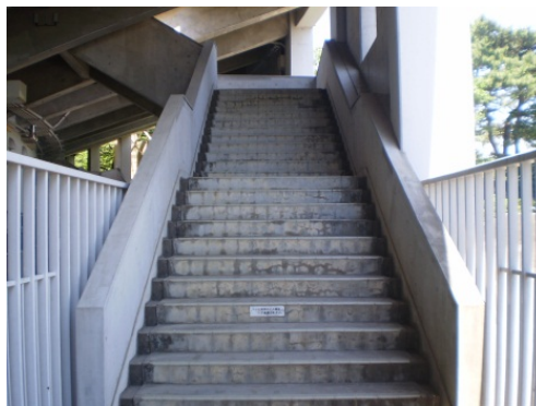
【UD化非対応】 ①観客席へは階段のみ