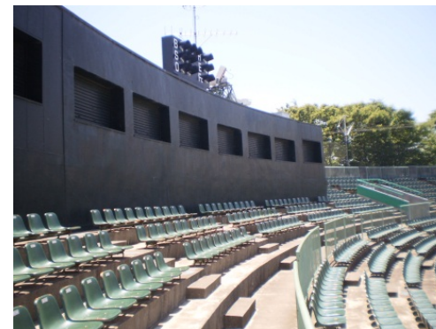
【UD化非対応】 ②スタンド内車いす導線確保