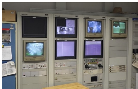
【監視カメラ】 落雷の影響による故障