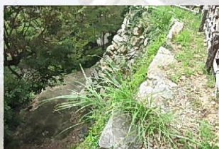
⑧出隅（天守曲輪南東隅）

巨石を用いた部分は算木積になっていません。また、横長石も不揃いで、算木積とはいえない部分もありますので、算木積といわない方がよいです。