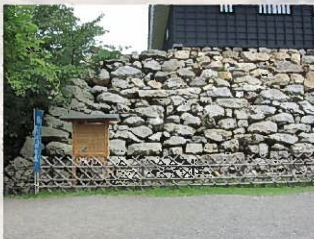
①布積と未発達な算木積(天守台)

上部は幕末および現在の天守を建てる時に積み直したものとされますが、下部を見ると石を横に横にと並べるように積んでいるのがわかります。途中で並びがはつきりしくなくなりますが、横並びの石の間に上段の石を落とし込んでいません。