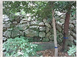
⑤古い石垣と新しい石垣(本丸西側)

向かって左側の石垣は、布積です。これに対して右側の石垣は、石材を斜めに使い、石と石の間に落とし込むように積んだ谷積です。右側は、崩落した石垣を幕末以降に積み直した結果です。