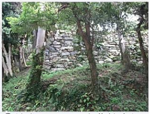
④鉢巻石垣(天守曲輪南側)

高石垣を積み上げる技術が確立していなかった点や、石材不足が原因していたと考えられます。