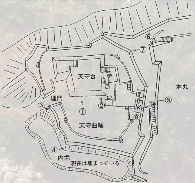
天守曲輪概念図と写真撮影位置

邪は輪取りともいいますが、石垣が内側に大きく弧を描くように積まれているもので、天守曲輪西側の埋門南側で観察できます。さらに南にいくと、一旦竈隅となった後に