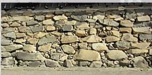
野面乱積（彦根城太鼓櫓）