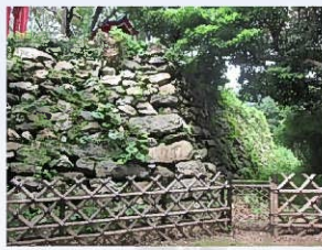
⑦鎬隅（天守曲輪北東隅）

鎬隅は、天守曲輪各所で観察できますが、北東隅がもっとも観察し易い場所です。鎬隅は、90度より大きな鈍角で石垣が折れ曲がる隅部のことです。関が原の戦い以前の古い城に多く見られます。隅石をファスナーのように少しだけかみ合わせて積んだ浜松城のような鎬隅が古い技法です。