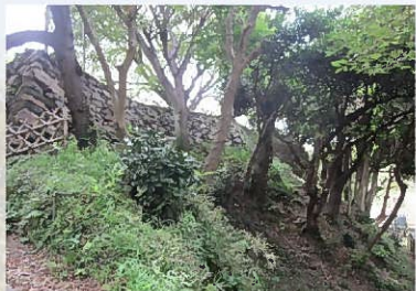
③邪と屏風折(天守曲輪西側)

関ヶ原合戦以前に多いといわれています。天守台の南西隅(写真①左隅)では、隅部の石材があまり長くない、算木積の特徴である長短交互の振り分けがはっきりしていません。関ヶ原以前に積まれたものと思われます。それとは対照的に南東部(写真②)は、古式な野面積ですが、完全な算木積になっており、幕末の地震で傷んだために積み直されたものと思われます。