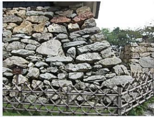
②完全な算木積(天守台) 縦方向に隙間が通っている所から右側が新しい。