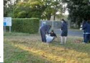
蜷塚遺跡の清掃活動▶

蜷塚遺跡や佐鳴湖畔の市街地を舞台に、漕艇・清掃・娯楽・調査研究など人々の活動が受け継がれている。