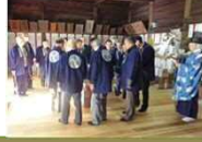
蒲神明宮御田打ち▶

天竜川下流域に広がる古代条里制水田や荘園の区画を残した集落の神社では、地域性豊かな祭礼が伝えられている。