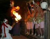
川名のひよんどり▶

都田川・阿多古川沿いの中山間地域の寺堂などを舞台に、生業と関係する正月行事が、継承されている。